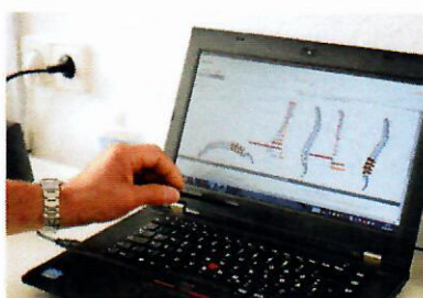
Visuele voorstelling van afwijkingen in uw rug